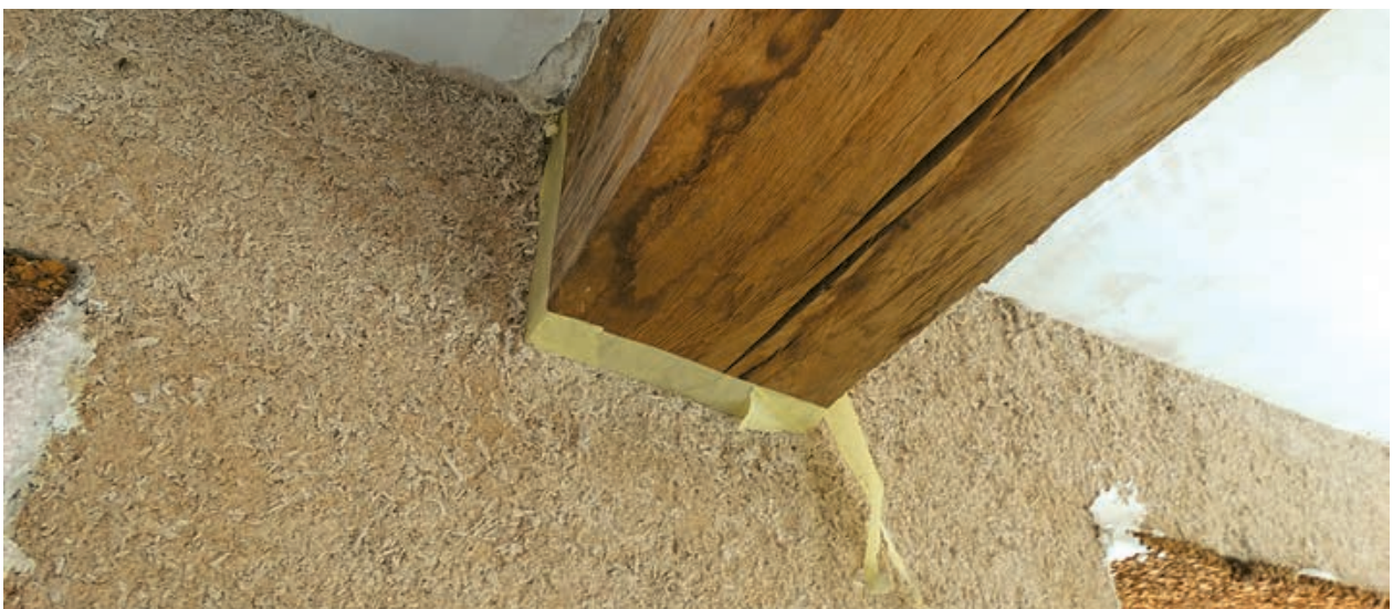
17. Noircissement d'une poutre apparente suite au contact avec la chaux.