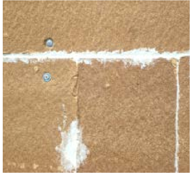
22. Joints silicone entre panneaux de fibre de bois : risque de ponts thermiques