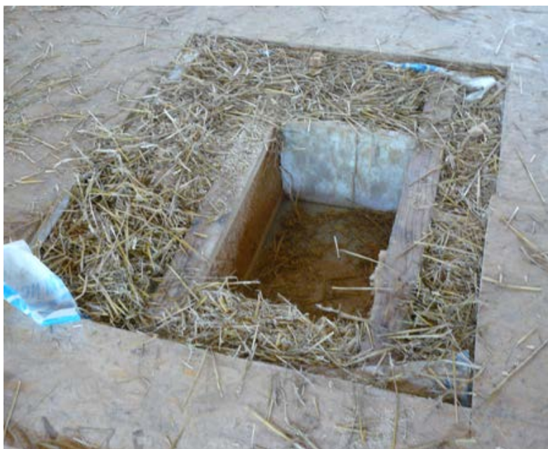
2. Traces d'humidité sur la paroi et dans le fond du caisson