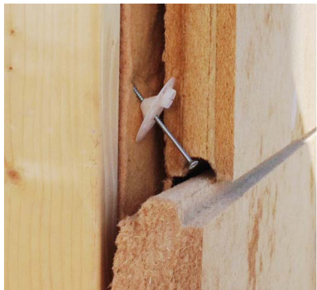
23. 24. Mauvaise mise en œuvre : plaques abîmées - plaques non jointives - fixations dans les joints - nombre de fixations non conformes -...