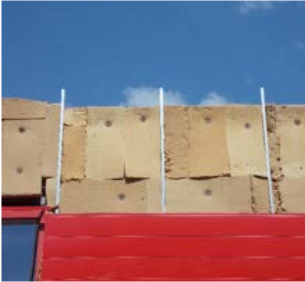
21. Mise en œuvre fantaisiste d'un isolant en fibre de bois : risque de ponts thermiques