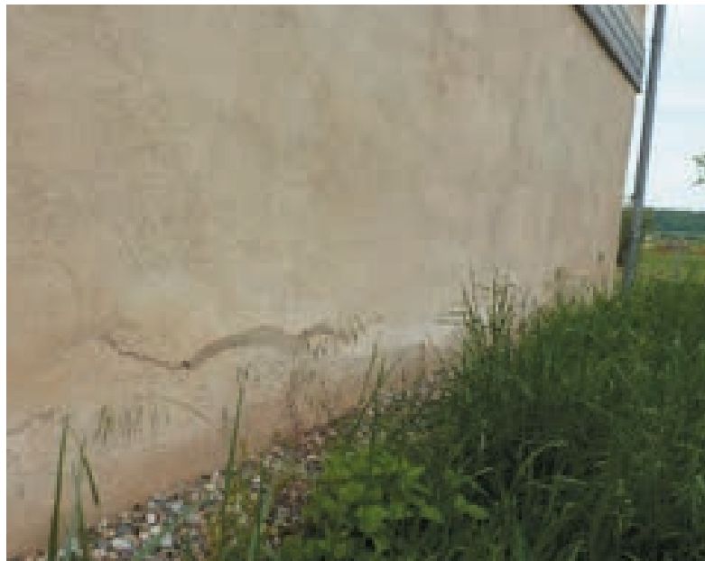
1. Remontées capillaires (non-respect des Règles professionnelles)

La paille étant un matériau putrescible, l'attaque des moisissures peut être très rapide. Les symptômes apparaissant immédiatement, les désordres et sinistres liés à des défauts de conception et/ou de mise en œuvre sont la plupart du temps détectés avant la fin du chantier ce qui permet de les corriger facilement. Le remplacement de la paille atteinte peut ainsi être réalisé, soit par de nouvelles bottes de paille saine, quelle que soit la technique (bottes nues ou bottes en caisson), soit par un autre matériau (ouate de cellulose ou fibre de bois) dans le cas de caissons.