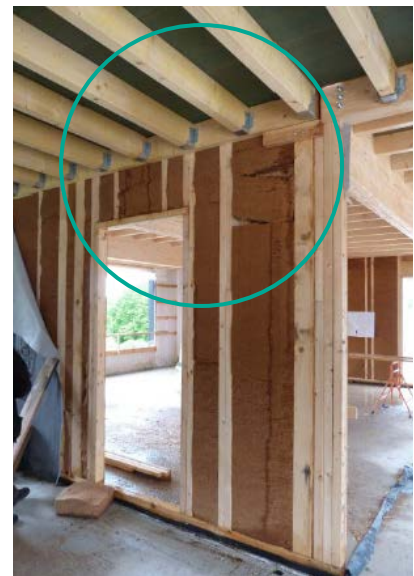
18. 19. 20. Tassement de la fibre de bois suite à une arrivée d'eau en toiture en cours de chantier